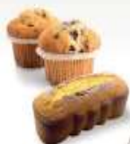
PRODOTTI DA FORNO