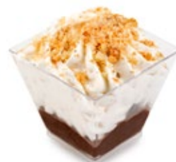
Κούκις Μπισκότο Cookies Biscuit