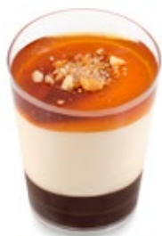
Καραμέλα Σοκολάτα Caramel Chocolate