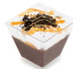
Σοκ. Τόφι Καραμέλα Όραιο Choc. Toffee Caramel Oraio