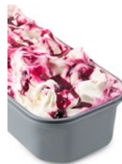
Γιαούρτι Αμαρένα Yogurt Amarena