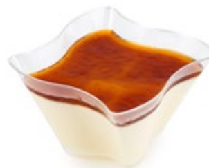
Πανακότα Καραμέλα Caramel Panakota