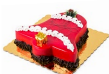
Καμπάνα Σοκολάτα Φράουλα Strawberry Chocolate Bell