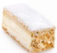
Μιλφέιγ Βανίλια Millefeuille