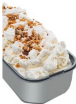
Παρφέ Βανίλια Vanilla Parfe