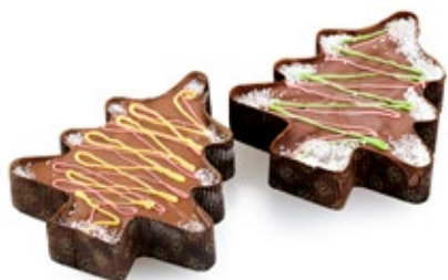
Κέικ Δέντρο Σοκολάτας Chocolate Cake Tree