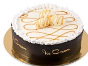
Βανίλια Μαδαγ. Καραμέλα Madagascar Vanilla Caramel