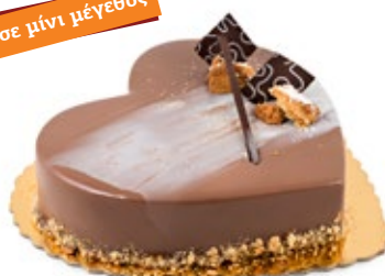
Κούκις Μπισκότο Cookies Biscuit Heart