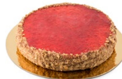
Σοκολάτα Φράουλα Chocolate Strawberry