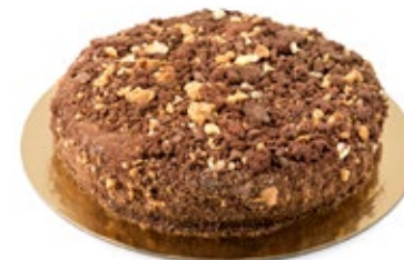
Μπλακ Πέρλ Black Pearl