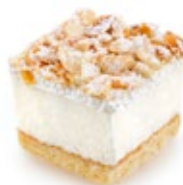
Γκράν Μαρνιέ Grand Marnier