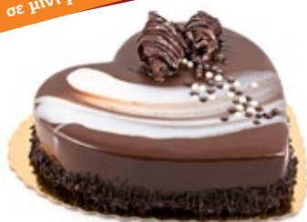
Σοκολάτα Καρδιά Chocolate Heart