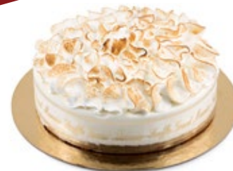
Σουφλέ Γκράν Μαρνιέ Soufflé Grand Marnier