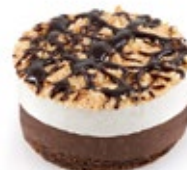
Κούκις Μπισκότο Cookies Biscuit