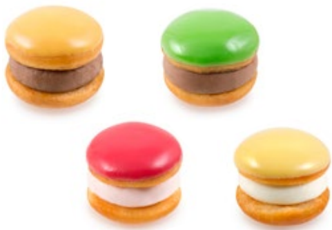
Κωκάκια Πολύχρωμα Kokakia multicolor