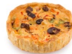
Τάρτα Ατομ. Μεσογειακή Νηστ. Individual Tart Mediterranean