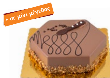
Μους Γάλακτος Milk Chocolate Mousse