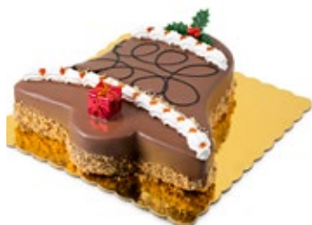
Καμπάνα Κούκις Μπισκότο Cookies Biscuit Bell