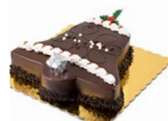
Καμπάνα Σοκολάτα Chocolate Bell