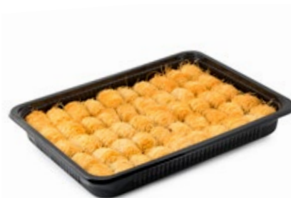
Καταίφι Μίνι Mini Kataifi