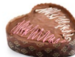
Κέικ Καρδιά Σοκολάτας Chocolate Cake Heart