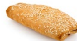
Ελιόπιτα Ατομική Individual Olive Pie