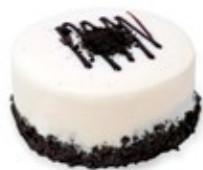
Όραιο Μπισκότο Oraio Biscuit