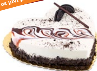
Όραιο Μπισκότο Oraio Cookies Heart