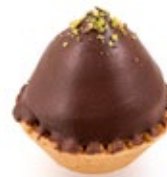
Ταρτάκι Σερενάκι Tartlet Serano Chocolate