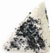
Τρίγωνη Βανίλια Όραιο Triangle Vanilla Oraio