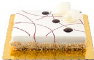
Μαστίχα Φρούτα του Δάσους Mastic Forest Fruits Coulis