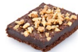
Μπράουνι Σοκολάτα Chocolate Brownie