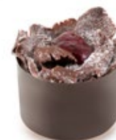
Μπλακ Φόρεστ Στρογγ. Round Black Forest