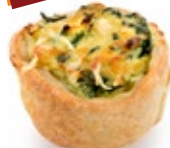
Ταρτάκι Σπανάκι Τυρί Mini Tart Spinach Cheese