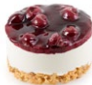
Τσιζ Κέικ Cheese Cake