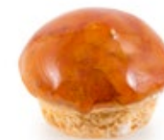
Σουδάκι Καραμέλας Mini Chou Caramel