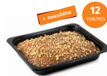
Καρυδόπιτα Walnut Pie