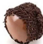
Νεγράκι Chocolate Bûche