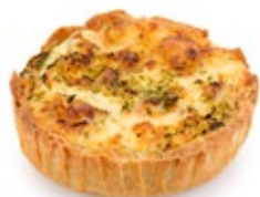
Τάρτα Ατομ. Κις Λορέν Individual Tart Quiche Lorraine