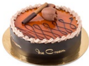
Καραμέλα Κακάο Caramel Cocoa