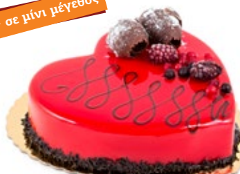
Φράουλα Σοκολάτα Καρδιά Strawberry Chocolate Heart