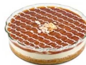
Εκμέκ Καταΐφι (Γυάλινο) EkmeK Kataifi (Crystal Tempered)