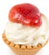
Ταρτάκι Φράουλα Tartlet Strawberry