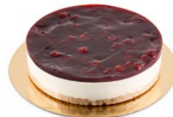
Τσιζ Κέικ Cheese Cake