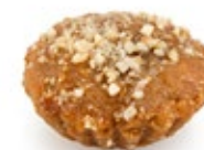
Μελομακάρονο Γεμιστά με καρύδι Melomakarono Stuffed with Walnuts