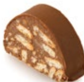
Μωσαϊκό Μινι Γάλακτος Mini Milk Mosaic