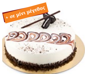
Όραιο Μπισκότο Biscuit Oraio