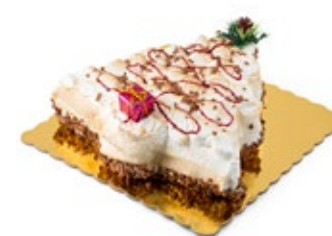
Δέντρο Γκράν Μαρνιέ Grand Marnier Tree