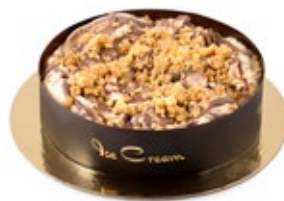
Κούκις Μπισκότο Cookies Biscuit