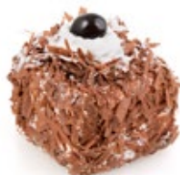
Μπλακ Φόρεστ Τετράγωνη Black Forest (Square)