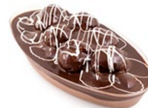
Γόνδολα Προφιτερόλ Profiterol Gondola Plastic Bowl