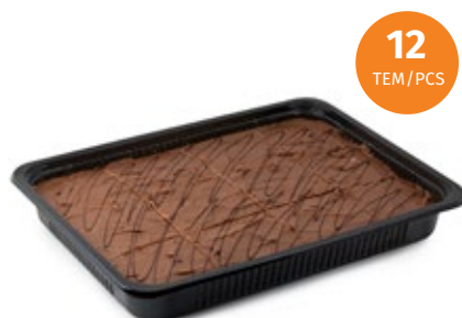
Σοκολατόπιτα Chocolate Pie