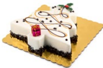
Δέντρο Βανίλια Σοκολάτα Vanilla Chocolate Tree