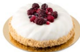
Τιζ Κέικ Cheese Cake