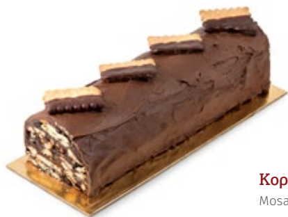
Κορμός Μωσαϊκό Mosaic Bûche