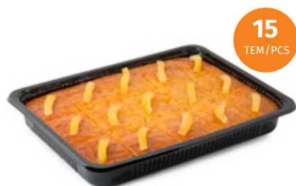
Λεμονόπιτα Lemon Pie