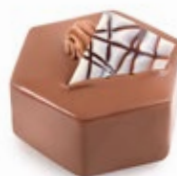
Μους Σοκολάτα Γάλακτος Milk Chocolate Mousse