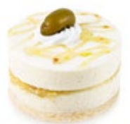
Βανίλια Μαδαγ. με γλυκό Ελιάς Madagascar Vanilla & Sweet Olive