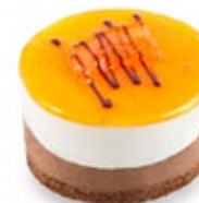
Σοκολάτα Πορτοκάλι Orange Chocolate