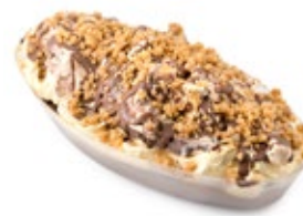
Μπράουνι Κούκις Brownie Cookies