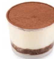
Τιραμισού Μασκαρπόνε Tiramisu Mascarpone