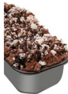
Παρφέ Σοκολάτα Chocolate Parfe