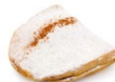
Σκαλτσούνι Ατομικό Individual Skaltsouni