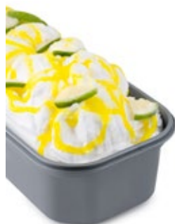
Σορμπέ Λεμόνι Lemon Sorbet