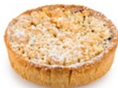
Τάρτα Κεράσι Cherry Tartlet