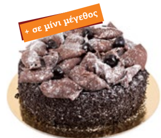
Μπλάκ Φόρεστ Black Forest