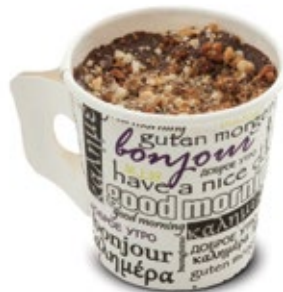
Παρέ Σοκολάτα Chocolate Parfe