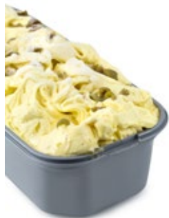
Βανίλια Μαγαδασκ. Γλυκό Ελιάς Madagascar Vanilla with Sweet Olive