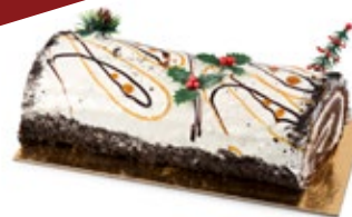
Κορμός Οραιο Oraio Bûche