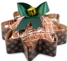
Κέικ Αστέρι Αμυγδ. Star Almond Cake