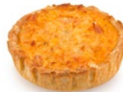
Τάρτα Ατομ. Φέτα Ντομάτα Βασιλικό Individual Tart Feta Tomato Basil