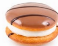
Κωκ Ατομικό Kok