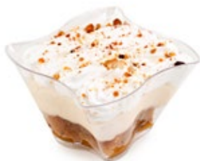
Εκμέκ Καταΐφι Ekmek Kataifi