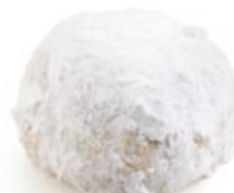
Κουραμπιές Αμυγδ. Almond Kourabies