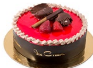
Φράουλα Κακάο Strawberry Cocoa