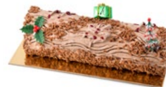
Κορμός Κάστανο Chestnut Bûche