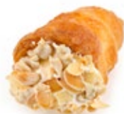
Κορνεδάκι Κρέμα Mini Korne Vanilla