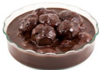
Προφιτερόλ Γκανάς Σοκολ. (Γυάλινο) Chocolate Ganache Profiterol (Crystal Tempered)