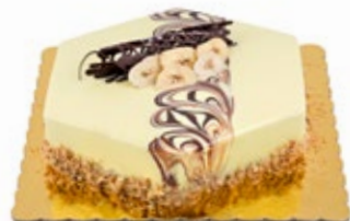
Μπανάνα Σοκολάτα Banana Chocolate