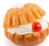
Μπαμπαδάκι Σαντιγύ Mini Baba Chantilly