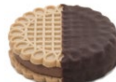
Μπισκότο Σοκολάτα Chocolate Biscuit