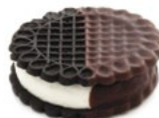
Μπισκότο Όραιο Oraio Biscuit