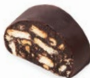
Μωσαϊκό Μινι Mini Mosaic