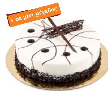
Ανάμεικτη Vanilla Chocolate