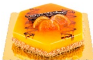
Πορτοκάλι Σοκολάτα Orange Chocolate