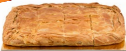
Πίτα Βέργας Σπανάκι Τυρί Spinach Cheese Pie