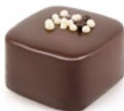
Μους Σοκολάτα Τετραγ. Square Chocolate Mousse