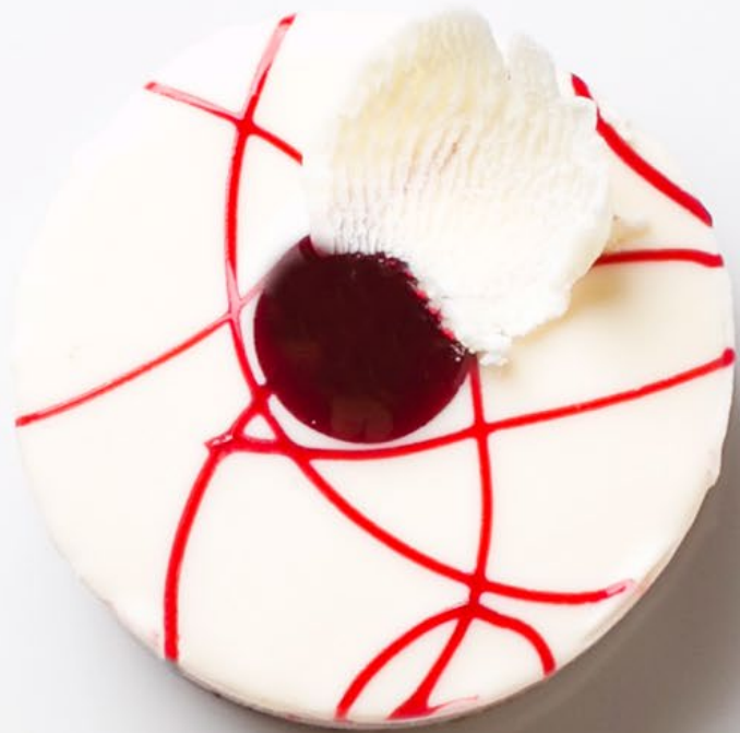
Μαστίχα Φρούτα Δάσους Mastic Forest Fruits Coulis