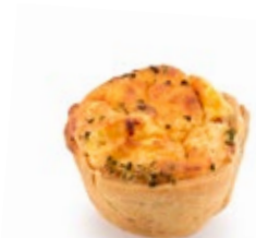
Ταρτάκι Μίνι Κις Λορέν Mini Tart Quiche Lorraine