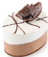
Ανάμεικτη Vanilla Chocolate