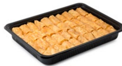
Γαλακτομπούρεκο Μίνι Mini Galaktoboureko