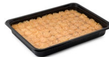
Κορμός Φιλέ Αμυγδάλου Μίνι Mini Almond Flakes Roll