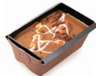
Barquette Προφιτερόλ Αλμυρή Καραμέλα Salted Caramel Profiterol Barquette