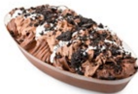
Σοκολατόπιτα Σοκολάτα Chocolate Pie Chocolate