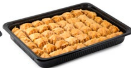
Μπακλαβάς Μίνι Mini Baklavas