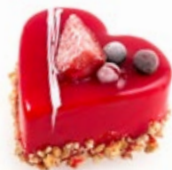
Καρδιά Φράουλα Strawberry Heart