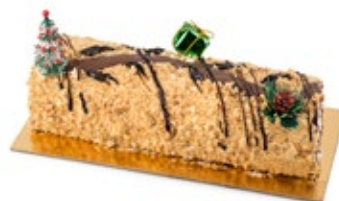
Κορμός Κούκις Μπισκότο Cookies Biscuit Bûche