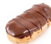
Εκλεράκι Σοκολάτας Mini Chocolate Eclair