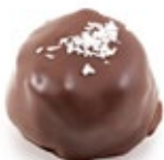
Κουραμπιές Αμυγδ. Μπουκιά Σοκολ. Almond Mini Kourabies Chocolate Covering