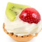
Ταρτάκι Εξότικ Tartlet Exotic