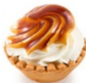
Ταρτάκι Καραμέλα Tartlet Caramel Flavour