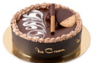
Βανίλια Σοκολάτα Vanilla Chocolate