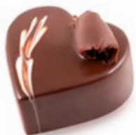
Καρδιά Μους Σοκολάτα Mousse Chocolate Heart