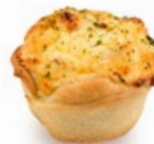
Ταρτάκι Φέτα Ντομάτα Βασιλικός Mini Tart Feta Tomato Basil