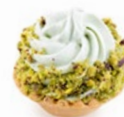
Ταρτάκι Φυσίκι Tartlet Pistachio Flavor