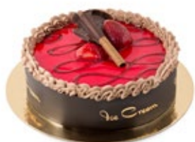
Σοκολάτα Φράουλα Chocolate Strawberry