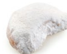
Κουραμπιές Αμυγδ. Μισοφέγγαρο Almond Kourabies Crescent