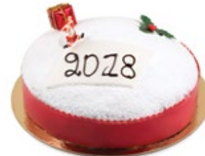
Βασιλόπιτα Κέικ Αμυγδ. (Ζάχαρη Άχνη) New Year Cake (Powdered Sugar)