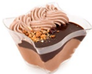
Μους Σοκολάτα Chocolate Mousse