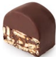
Μωσαϊκό Ατομικό Mosaic