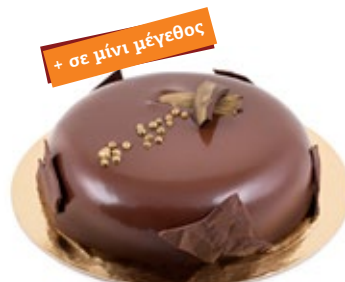
Μους Σοκολάτα Chocolate Mousse