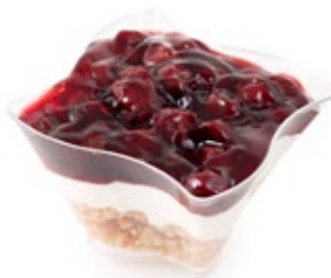
Τιζ Κέικ Cheese Cake