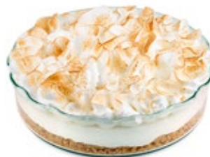
Λέμον Πάι (Γυάλινο) Lemon Pie (Crystal Tempered)