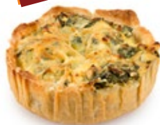
Τάρτα Ατομ. Σπανάκι Τυρί Individual Tart Spinach Cheese