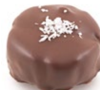
Κουραμπιές Αμυγδ. Σοκολ. Almond Kourabies Chocolate Covering