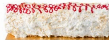
Βανίλια Μαδ. Κουλί Φρούτα Δάσους Madagascar Vanilla Coulis Forest Fruits