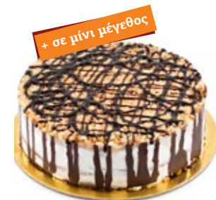
Κούκις Μπισκότο Cookies Biscuit