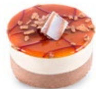
Σοκολάτα Καραμέλα Caramel Chocolate