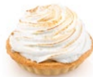
Τάρτα Λέμον Πάι Lemon Tart