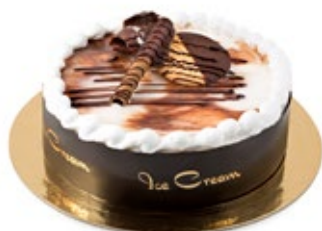
Ανάμεικτη Vanilla - Cocoa