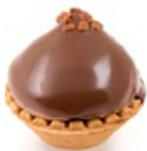
Ταρτάκι Φερέρα Tartlet Ferera