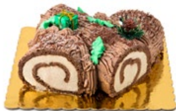
Κορμός Κάστανο (Ξύλο) Chestnut Bûche (Wood)