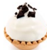
Ταρτάκι Όραιο Tartlet Oraio