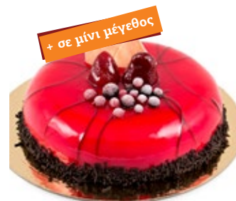
Φράουλα Σοκολάτα Strawberry Chocolate