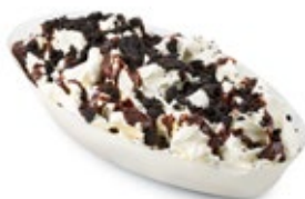
Σοκολατόπιτα Βανίλια Chocolate Pie Vanilla