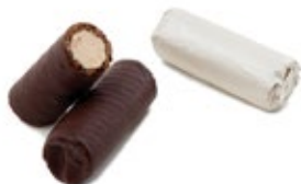
Πουράκι Κρέμας Μπουένα