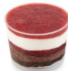
Σοκολάτα Φράουλα Chocolate Strawberry