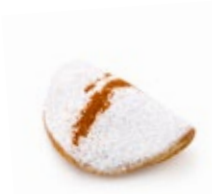
Σκαλτσούνι Μίνι Mini Skaltsouni