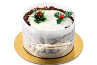
Χριστουγεννιάτικο Κέικ Christmas Cake