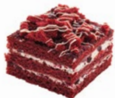
Ρεντ Βέλβεντ Red Velvet