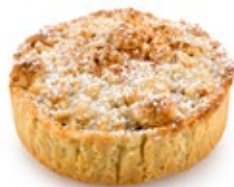
Τάρτα Μήλου Apple Tartlet