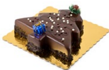
Δέντρο Σοκολάτας Chocolate Tree