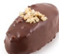
Μελομακάρονο Σοκολάτα Melomakarono Chocolate Covering