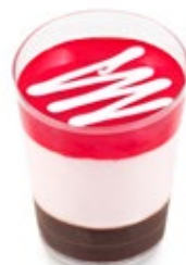
Φράουλα Σοκολάτα Strawberry Chocolate