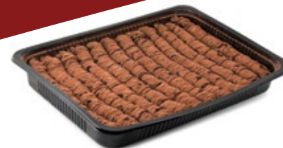
Σαραγλάκι κακάο Mini Cocoa Saragli