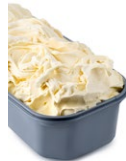
Βανίλιες Μαγαδασκάρης Madagascar Vanilla