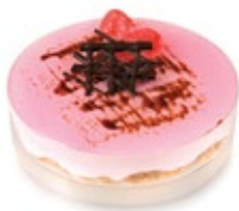
Τριαντάφυλλο Γκανάς Rose Chocolate Ganache