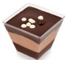
Μους Σοκολάτα Chocolate Mousse