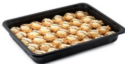
Φωλίτσα Μίνι (κρέμα λευκή) Mini Folitsa (white cream)