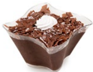
Προφιτερόλ Σοκολάτας Chocolate Profiterol