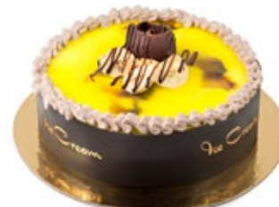
Μπανάνα Κακάο Banana Cocoa