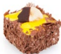
Μπανάνα Σοκολάτα Banana Chocolate