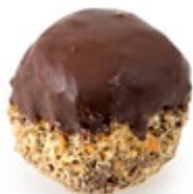
Μπουλ Κούκις Cookies