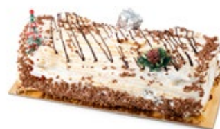
Κορμός Γκράν Μαρνιέ Grand Marnier Bûche