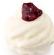
Βανίλια Μαγαδασκάρης Madagascar Vanilla