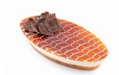
Γόνδολα Εκμέκ Καταΐφι EkmeK Kataifi Gondola Plastic Bowl