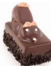
Ποντικάκι Σοκολάτα Chocolate Mouse