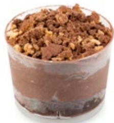
Μπλακ Πέρλ Black Pearl