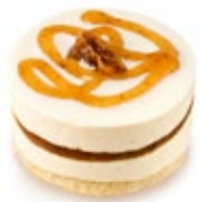
Βανίλια Μαδαγ. με γλυκό Σύκο Madagascar Vanilla & Marmelade Fig