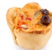
Ταρτάκι Μεσογειακό Νηστ. Mini Tart Mediterranean