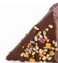
Τρίγωνη Σοκολ. Ξηρ. καρπούς Triangle Chocolate & Nuts