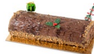
Κορμός Φερέρα Ferera Bûche