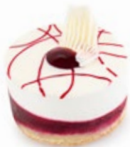
Μαστίχα Φρούτα Δάσους Mastic Forest Fruits Coulis