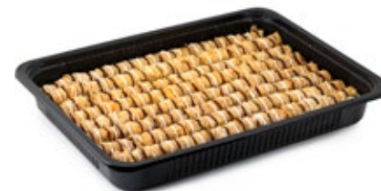
Σαραγλάκι Μίνι Mini Saragli