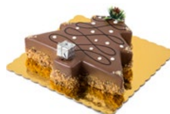
Δέντρο Κούκις Μπισκότο Cookies Biscuit Tree