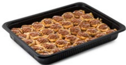
Φωλίτσα Μίνι (κρέμα φουντ.) Mini Folitsa (Hazelnut cream)