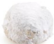
Κουραμπιές Αμυγδ. Μπουκιά Almond Kourabies Mini