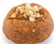
Μελομακάρονο Μπουκιά Melomakarono Mini