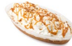
Εκμέκ Καταιφι Μαστίχα Mastic Ekmek Kataifi