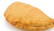
Τυρόπιτα Κουρού Φέτα Kourou Feta Pie