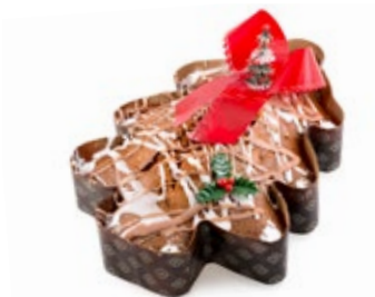
Κέικ Δέντρο Αμυγδ. Tree Almond Cake