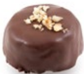
Μελομακάρονο Μπουκιά Σοκολ. Melomakarono Mini Chocolate Covering