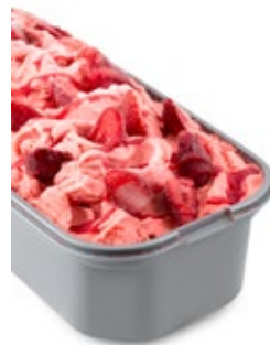
Σορμπέ Φράουλα Strawberry Sorbet