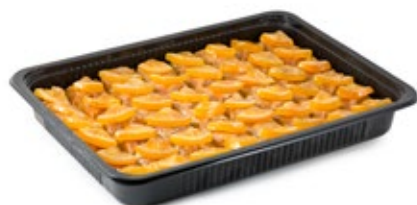
Μπουκέ Πορτοκάλι Μίνι Mini Orange Bouquet