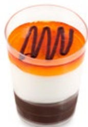
Πορτοκάλι Σοκολάτα Orange Chocolate