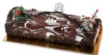
Κορμός Σοκολάτα Chocolate Bûche