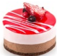
Σοκολάτα Φράουλα Strawberry Chocolate