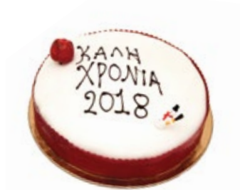
Βασιλόπιτα Κέικ Αμυγδ. (Πάστα Ζάχαρης) New Year Cake (Regalice)