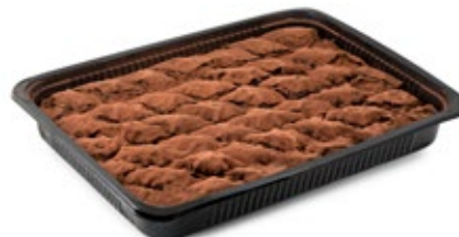
Μπακλαβαδάκι Κακάο Μίνι Mini Cocoa Baklavas