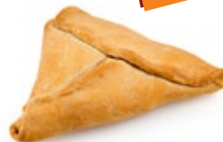
Τρίγωνη Ατομ. Πράσσο Τυρί Ind. Triangle Cheese & Leek Pie