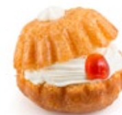
Μπαμπά Baba Chantilly