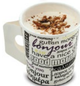
Παρέ Βανίλια Αμύγδαλα Vanilla Nuts Parfe