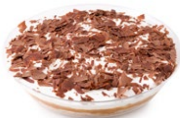
Μπανόφι (Πλαστικό Μπόλ) Banoffee (Plastic Bowl)