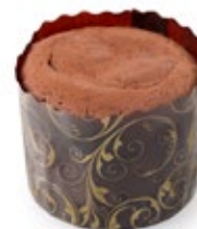
Σουφλέ Σοκολάτας Chocolate Souffle