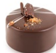
Σοκολάτα Αμύγδαλο Almond Chocolate